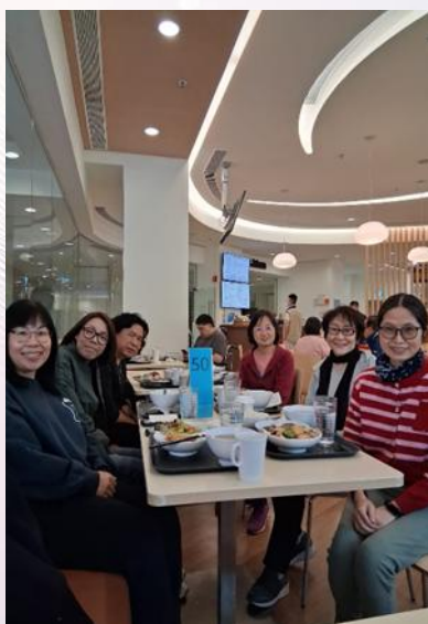
床邊探訪佈道後 一起用膳和分享