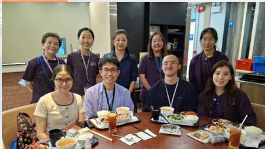
一起吃飯及分享互勉