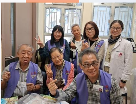
同心為院牧事工及義工祈禱