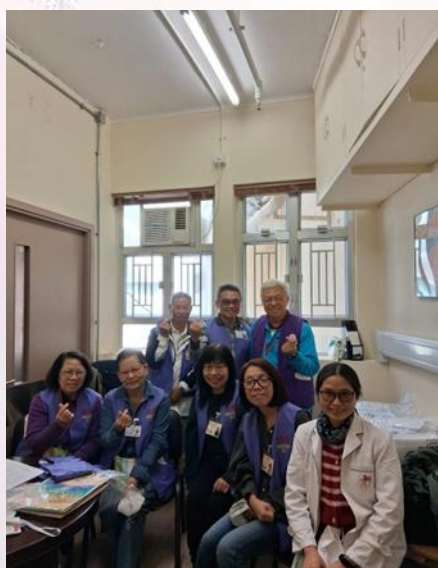
歡迎新義工來實習